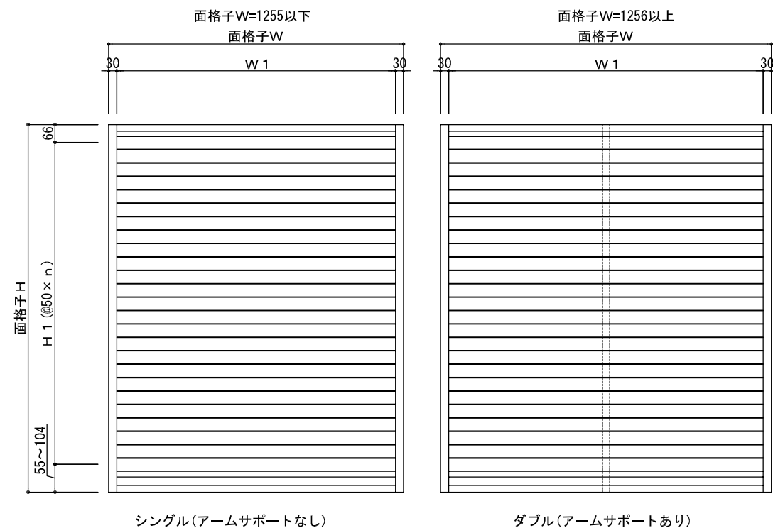
シングル(アームサポートなし)